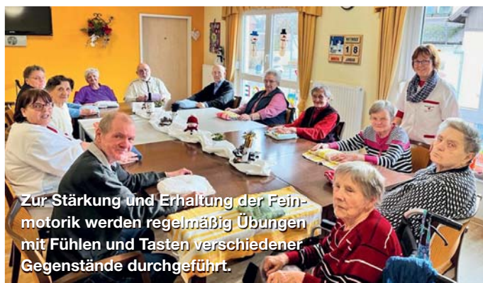
Zur Stärkung und Erhaltung der Feinmotorik werden regelmäßig Übungen mit Fühlen und Tasten verschiedener Gegenstände durchgeführt.

Der Tagesablauf wird strukturiert und aktiv-kreativ gestaltet – unter anderem mit Angeboten zur Verbesserung der Beweglichkeit, Gehirnjogging, Basteln, Singen, Besuch der ortsansässigen Kita, Ausflügen uvm.