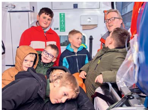
Im mitgebrachten Rettungswagen konnten die Kinder eine Menge entdecken.

„Bereits zum zweiten Mal haben wir das Deutsche Rote Kreuz in Sachsen-Anhalt mit einer Spendenaktion unterstützt. Dieses Mal wollten wir den DRK-Nachwuchs in den Schulen fördern“, so Smolka. Insgesamt 13.363 Euro kamen bei der Spendenaktion zusammen, bei der die rund 3.000 Helios-Mitarbeiter in Sachsen-Anhalt für jeden gelaufenen Kilometer einen Euro spendeten. Damit liefen die Pflegekräfte, Ärzte und das weitere technische Personal sieben Mal nach Solferino – dem Ort der ideellen Gründung der Rote-Kreuz-Bewegung – und wieder zurück. 2.227 Ki-