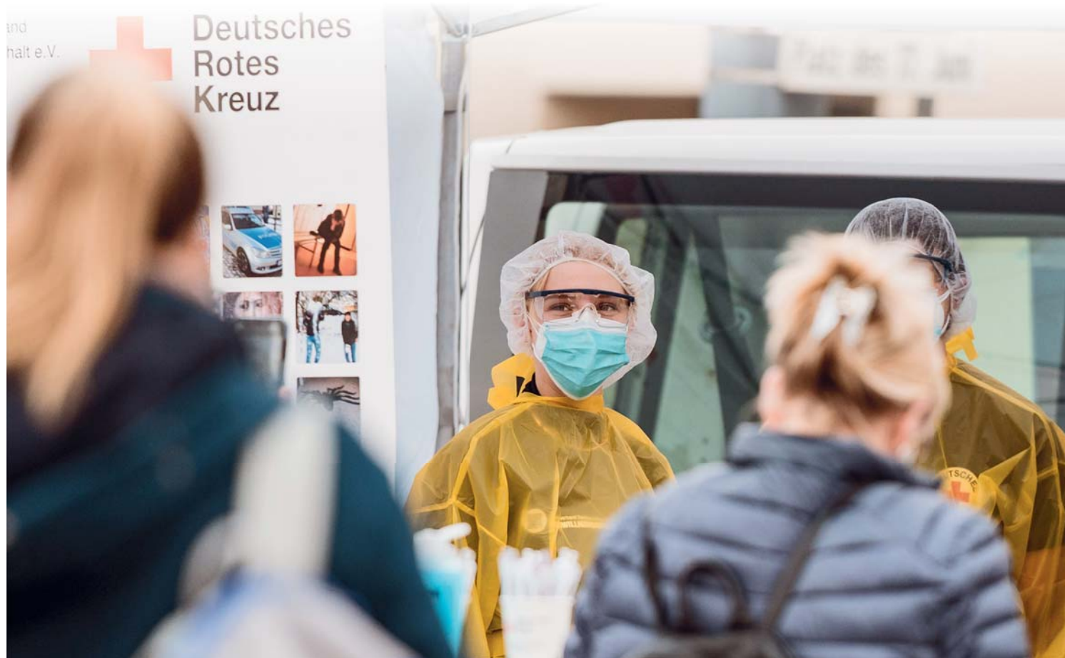
Der DRK Landesverband Sachsen-Anhalt möchte mit der Netzwerkstelle Kurzzeitengagement Synergien bündeln.