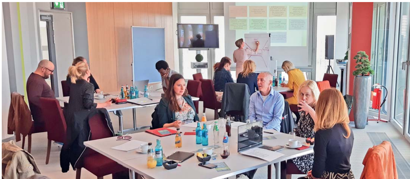
Beim Fachtag in Magdeburg ging es vor allem um das weitgefaste Thema Vernetzung.