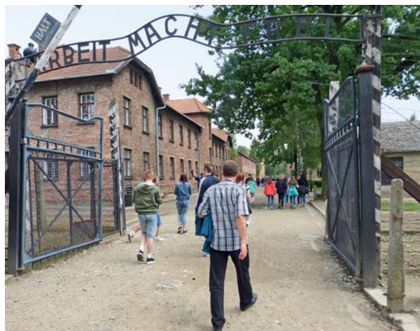
„Arbeit macht frei“ lautet der zynische Spruch am Eingang zum Stammlager Auschwitz, welches die Teilnehmenden besuchten.

Am nächsten Tag besuchten die Teilnehmer die zwei Lager des Konzentrationslagers Auschwitz. Der Besuch im Lager war ohne