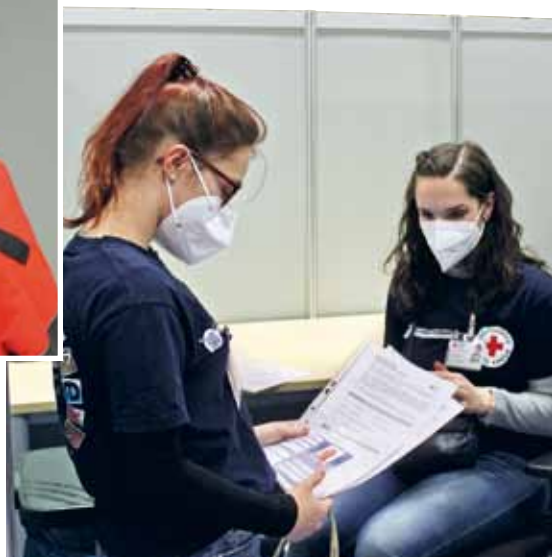
Zwei FSJlerinnen helfen im Impfzentrum in Halle (Saale).

Im Impfzentrum in der Heinrich-Perastraße in Halle (Saale) sind zum Beispiel mehr als 40 Rotkreuzlerinnen und Rotkreuzler aktiv. Davon sind 23 Freiwilligensozialdienstleistende (FSJler), die aufgrund des Lockdowns nicht mehr in ihren originären Einsatzstellen aktiv sein können, und die sich bereit erklärt haben, als Dokumentationsassistenten im Impfzentrum zu helfen. Gleichzeitig stellt der DRK-Kreisverband Halle-Saalkreis-Mansfelder Land erfahrene