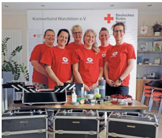
Sechs der insgesamt sieben ausgebildeten ehrenamtlichen Helfer aus dem Team Notfalldarstellung des DRK-Kreisverbandes Wanzleben

Das neue Wanzleber Team Notfalldarstellung kommt seit seiner Gründung nunmehr regelmäßig zum Üben und Ausprobieren zusammen. Finanzielle Mittel aus der vergangenen Weihnachtsspendensammlung machten es möglich, für jeden Ehrenamtlichen