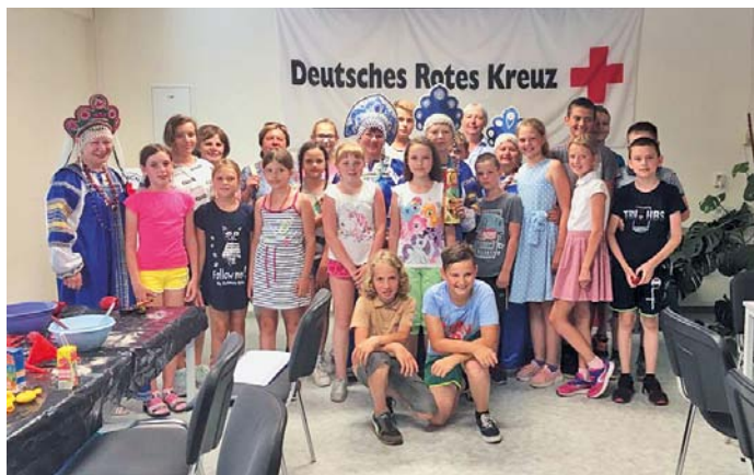
Die Kinder zu Gast im DRK-Mehrgenerationenhaus