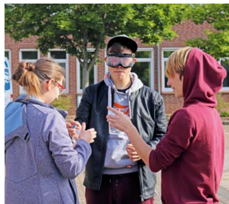
Mit der Rauschbrille kann auch ein Glas Wasser zur Herausforderung werden