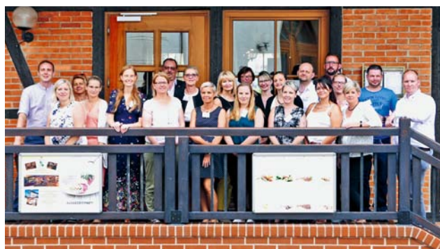
Die „Konfliktberater mit System“ trafen sich Anfang Juni gemeinsam mit Unterstützern und ihren Führungskräften zur Zertifikatübergabe in Halle (Saale)

Wir vom Bildungswerk sind dankbar für die Erfahrungen, die wir während der Qualifizierung mit allen Engagierten aus unserem vielfältigen Verband sammeln durften und freuen uns, auch künftig gemeinsam für Zusammenhalt und Teilhabe einzustehen.