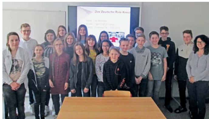
Schüler der ehemaligen 5. Klasse der Christophorusschulen Droyßig (CJD)