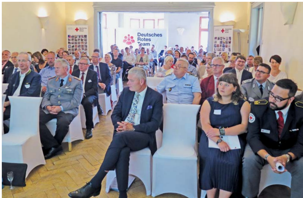
Zahlreiche Gäste aus Politik, Justiz, Militär und Zivilgesellschaft waren zur Veranstaltung gekommen