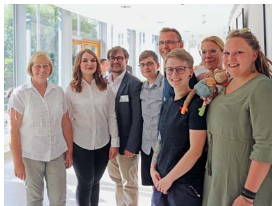
Die AG KinderSommer bei der Ausstellungseröffnung im Landtag mit Landtagspräsidentin Gabriele Brakebusch (links)

Bis Ende August konnte man im Landtag Sachsen-Anhalt die Ausstellung „30 Gesichter und Geschichten aus dem KinderSommer“ sehen. Die Plakatserie wurde anlässlich des 30-jährigen Bestehens der integrativen Ferienfreizeit erstellt. Die Plakatserie zeigt verschiedene Charaktere und Personen, die durch, im und mit dem KinderSommer