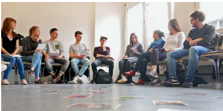
Die Lehramts-Studierenden der MLU lernen gemeinsam etwas über das Glück