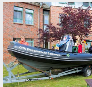
Die Kinder enterren das Rettungsboot der DRK-Wasserwacht