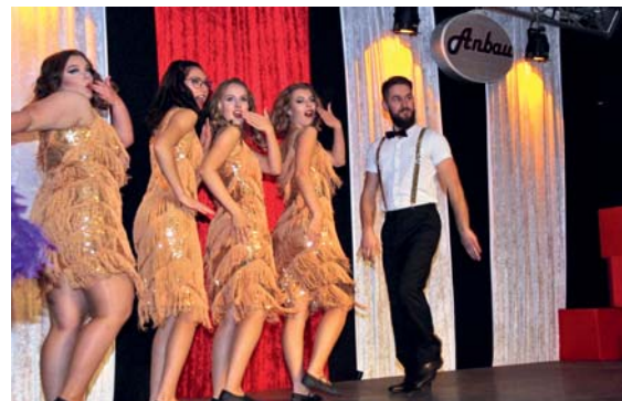
Die Tanzgruppe „Caba-red“ aus Ummendorf